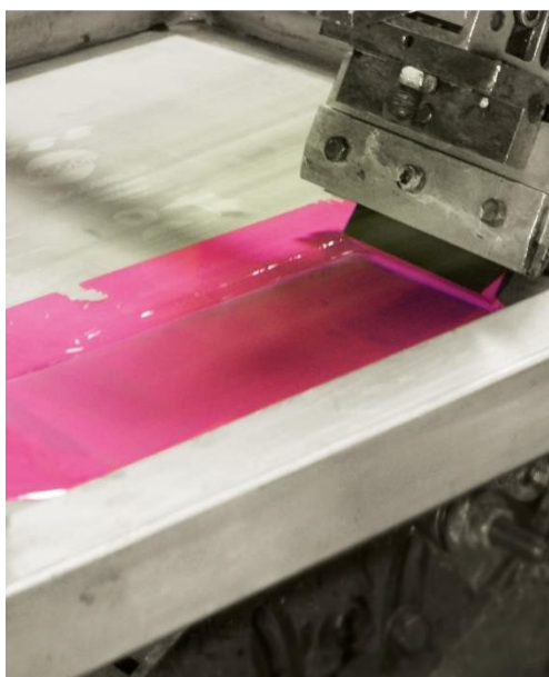
Solvent de curățare pentru toate familiile de cerneluri și lacuri pe bază de solvenți sau de origine vegetală

iBiotec® Tec Industries® Service Z.I La Massane - 13210 Saint-Rémy de Provence – France Tél. +33(0)4 90 92 74 70 – Fax. +33 (0)4 90 92 32 32 www.ibiotec.fr